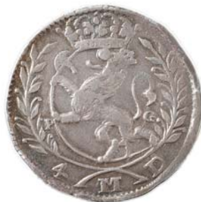
49 4 Mark 1691. R.K. kanthakk/edgenick