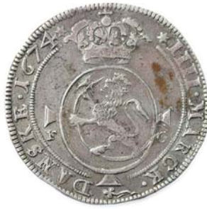
41 4 Mark 1674. R.K. 42 4 Mark 1679.