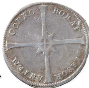
45 4 Mark 1683. Danebrog 46 4 Mark 1683. ex R.K.