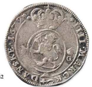
NM.69 1+ 2 000,- NM.73 1+ 2 000,-