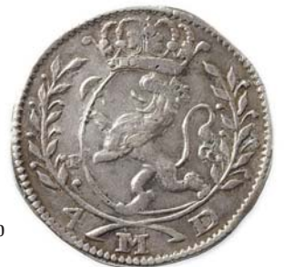
NM.86, S.32-34 1+ 3 000,-