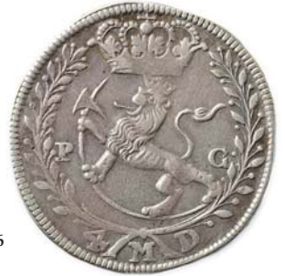
NM.78, H60, S5 1/1+ 7 000,- NM.77, H.55 1+ 2 000,-