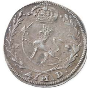
43 4 Mark 1681. 44 4 Mark 1683. R.K. Danebrog