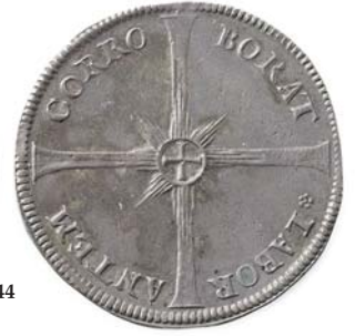
NM.75 S.27-29 1+ 2 400,- NM.78 1+ 9 000,-