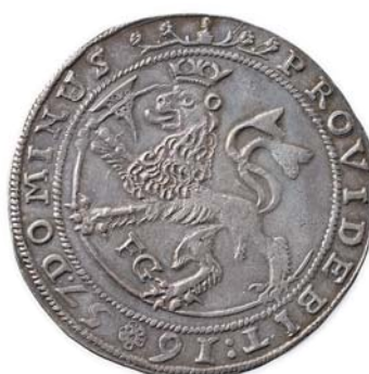
26 1 Speciedaler 1657. R.K.ex Ragozy 1959 kr.410+salær