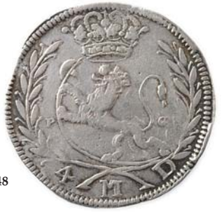
NM.80, H55, S9 1+ 3 200,- NM.84, H55, S10 1/1+ 2 000,-