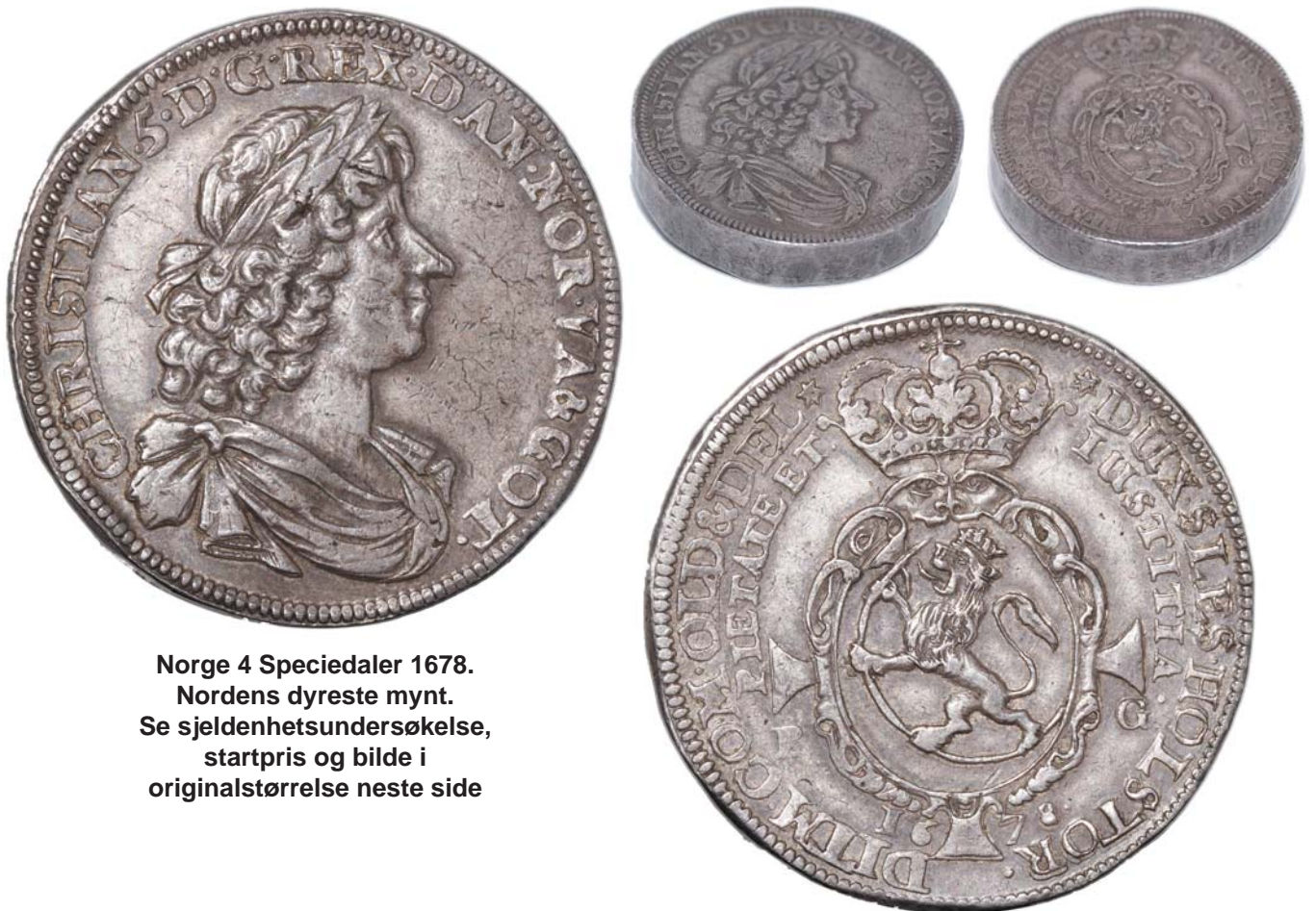
Norge 4 Speciedaler 1678. Nordens dyreste mynt. Se sjeldenhetsundersøkelse, startpris og bilde i originalstørrelse neste side

[Note 1: Fondet L. E. Bruuns Møntsamling, som ligger båndlagt på et slott i 100 år, eier et antall 4 dobbelte speciedalere.]