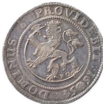
24 1 Speciedaler 1654 R.K.ex NF 1954